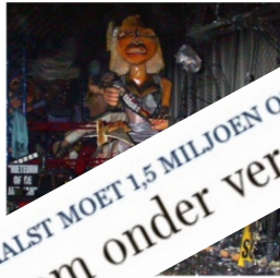
van de organisatie. 'Met deze uitspraak' een bom onder verenigingsleven in Aalst'.

Dertig Aalsterse carnavalisten moeten elk 50.000 euro betalen. Hun praalwagen brandde in 2004 af en nu oordeelt de rechter dat niet de verzekering maar zijzelf moeten opdraaien voor de schade. Omdat hun carnavalsgroep een feitelijke vereniging is, zijn ze zelf aansprakelijk.