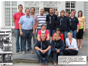
'Maandlang werk in rook opgegaan'

Dertig Aalsterse carnavalisten moeten elk 50.000 euro ophoesten. Hun praalwagen brandde in 2004 af en nu oordeelt de rechter dat niet de verzekering maar zijzelf moeten opdraaien voor de schade. Omdat hun carnavalsgroep een feitelijke vereniging is, zijn ze persoonlijk aansprakelijk. "Wie zal zich nog engageren in een comité of een club als je daarmee het risico loopt jezelf te ruïneren?"