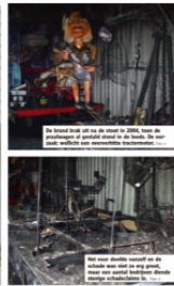
Met een draaije vooraf op de draai van de praalwagen, werd de loods in brand gestoken. De schade aan de loods bedroeg 1,5 miljoen euro.

De praalwagen van de Aalsterse carnavalisten brandde af in de nacht van 11 op 12 februari 2004. De schade aan de loods bedroeg 1,5 miljoen euro. De carnavalsgroep moest de schade betalen.