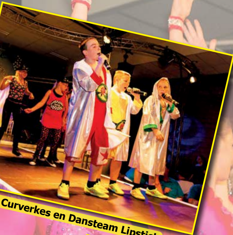
Curverkes en Dansteam Lipstick