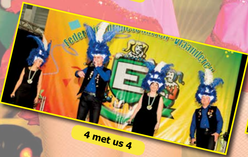
4 met us 4