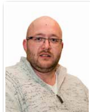
Wins Gerd Provinciaal commissaris Limburg