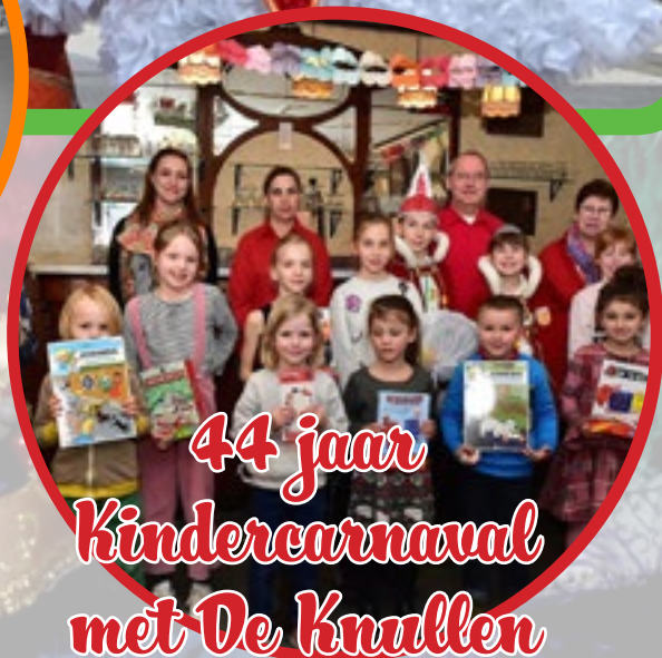
44 jaar Kindercarnaval met De Knullen