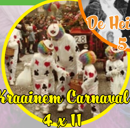
Kraainem Carnaval 4 x 11