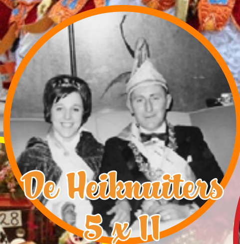
De Heiknuiters 5 x 11