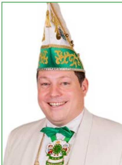
Geachte lezers Beste carnavalsvrienden

Het carnavalsseizoen 2024 is dan wel niet het kortste seizoen dat we ooit gehad hebben, maar we zijn er niet ver van verwijderd. Na de feestdagen was er dus nauwelijks tijd om het glas te heffen op het nieuwe jaar, want onmiddellijk na de feestdis was het in loods en ateliers alle hens aan dek om de laatste hand te leggen aan wagens en kledij, zodat alles tijdig afgewerkt was voor de grote apotheose van het carnavalsseizoen, wat zonder twijfel de carnavalsstoeten zijn. Tegen de tijd dat u deze gazet in handen krijgt, zijn er bijgevolg al heel wat carnavalsoptochten doorheen het Vlaamse land getrokken.