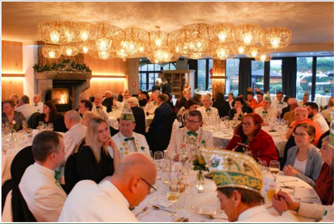
Na 3 jaar kon het FEN-feestbanket eindelijk opnieuw plaatsvinden. In 'Hof ten Bosse' (Heusden, Oost-Vlaanderen) werden we culinair, muzikaal en humoristisch in de watten gelegd.